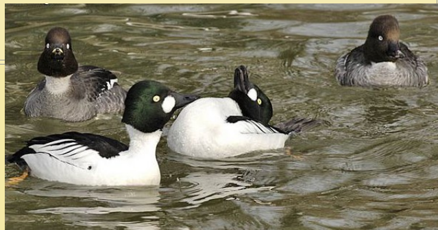
Garrot à œil d'or : ♂ et ♀

C'est un peu plus tard dans l'hiver que les mâles s'agitent et offrent le spectacle curieux de leurs danses. Hérissant les plumes de la tête, les joues gonflées, les voici qui s'approchent des femelles. Ils gonflent leur poitrine pour en exhiber la blancheur, tendent le cou à la verticale, puis rejettent brusquement leur tête en arrière en touchant le bas du dos avec la nuque. Sans se soucier du froid, les Garrots s'adonnent à leur cour nuptiale, remontés comme des jouets mécaniques.