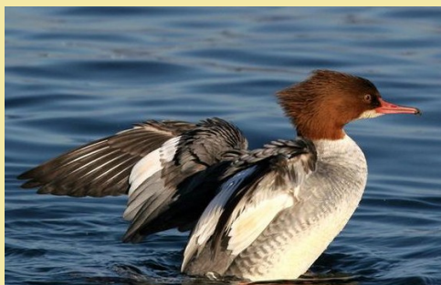
Harle bièvre ♀

Sa silhouette, comme son bec, trahissent des habitudes de pêcheur. Son corps effilé glisse rapidement sur l'eau. Dès qu'il repère une proie, il plonge et la poursuit comme un éclair. S'il le saisit, le poisson ne lui échappera pas, prisonnier de son bec en scie au crochet acéré.